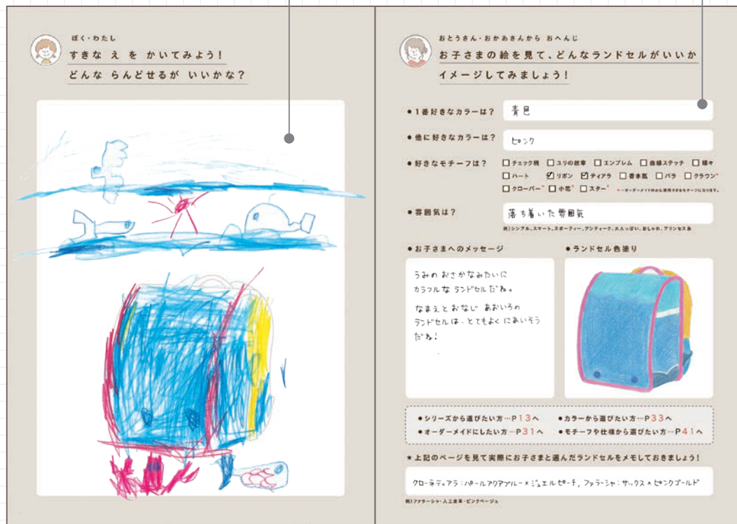
お子さまのお絵かきスペース

お父さん・お母さんがお子さまの絵をみて どんなランドセルがいいかイメージしてみましょう！